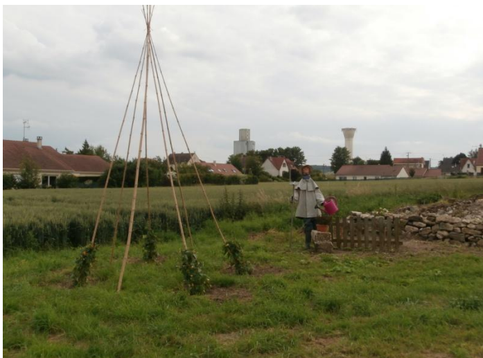
Le futur jardin des Enfants